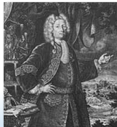
František Antonín Špork

Když zabloudíme až do daleké historie, nesmíme zapomenout na působení tako-vých rodáků, jako byli Jan Karel Špork – pomohl císaři Ferdinandovi III. k vítězství nad Turky; František Antonín Špork – advokát, založil lovecký řád