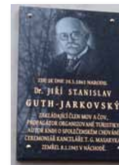
Jiří Gut Jarkovský

Jiří Stanislav Gut-Jarkovský – jazykový překladatel, zakladatel Českého olympijského výboru, předseda Klubu českých turistů, hradní ceremoniář a autor příručky pravidel slušného chování má v Heřmanově Městci na svém rodném domě nově odkrytou pamětní desku.