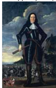
Jan Karel Špork

Rodáky z kraje pod Železnými horami lze tak trochu soustředit do určitých oblastí jejich zájmů a opravdu jmenovat jen ty nejnámější s pocitem, že díky omezené kapacitě této publikace nedojde k nějakému hněvu.